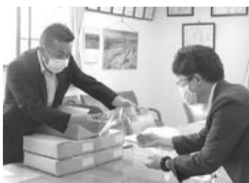
フェイスシールドの配布状況

教育現場の新型コロナウイルス対策に役立ててほしいと、ニッセー株式会社(本社:南アルプス市)は5月25日、北杜市に飛まつを防ぐフェイスシールド500枚を寄贈した。市内の小中学校、高校の教職員に配布され