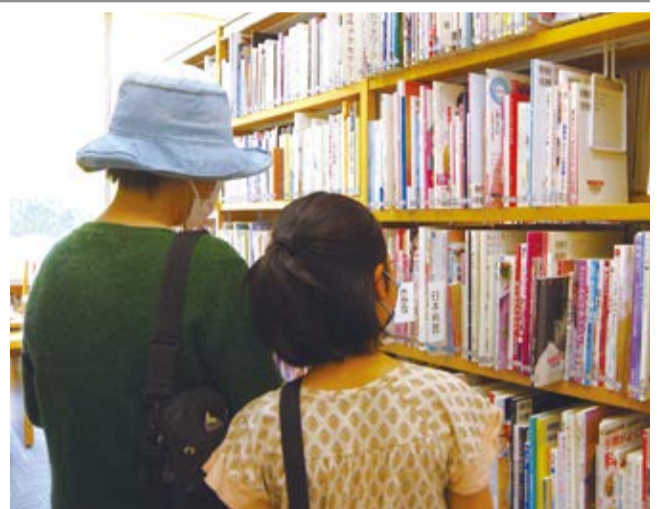
館内を見てまわり、本を選ぶ親子（むかわ図書館）

は、「久しぶりの学校で友達に会えてよかった。一緒に遊んだり、授業を受けられてうれしい」と話した。 市の教育委員会によると、6月1日から通常授業を再開する。臨時休校が長期に及んだことで不足した授業時間を確保するため、夏休みを短縮し、