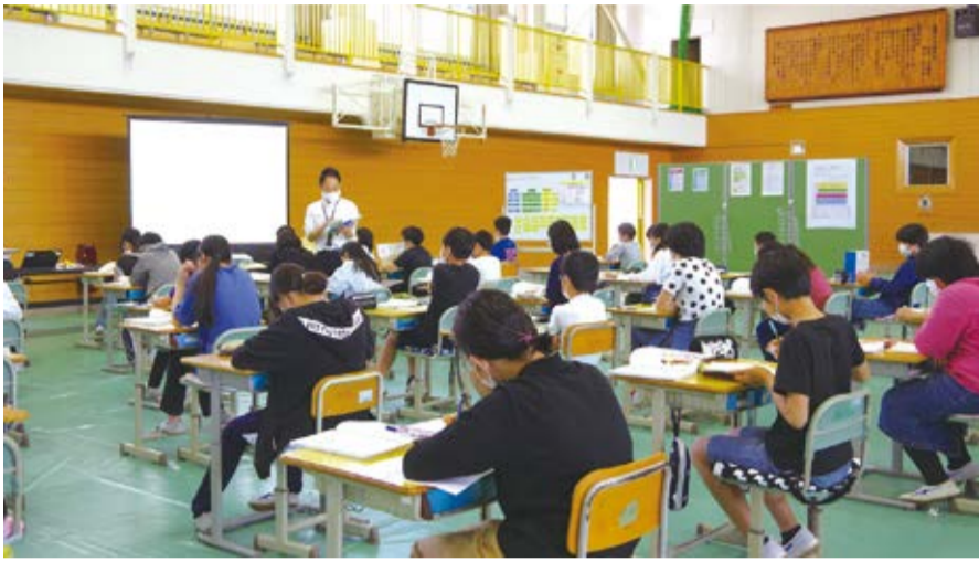
体育館を教室にして、授業を受ける市立須玉小学校の6年生たち

新型コロナウイルスの感染拡大で臨時休校していた市内の小中学校や高校が5月25日に再開し、朝の検温やマスクの着用、こまめな換気、人との距離の確保といった「新しい生活様式」を踏まえた学校生活が始まった。