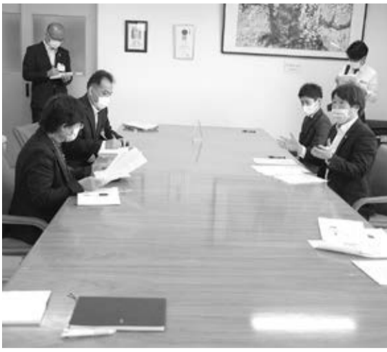
渡辺市長と対談する観光業者(5月22日)

同日の贈呈式で渡辺英子市長は、「ふるさとのことを思い行動してくれて本当にうれしく思う。市民生活に役立てていきたい」と感謝の思いを伝えた。(写真)