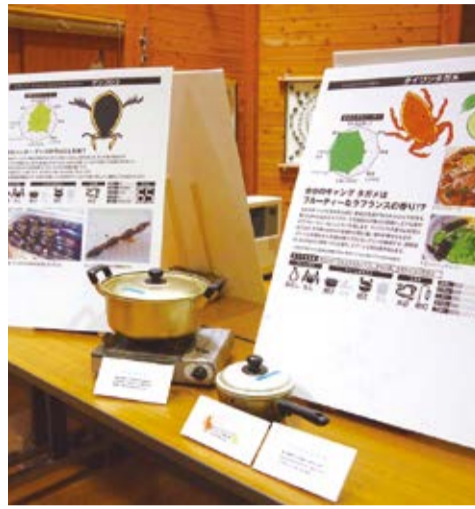
さまざまな昆虫食を紹介

特別展を延長 長坂町の北杜市オオムラサキセンターが5月26日に営業を再開した。5月上旬までを予定していた特別展「昆虫食ワールド」の会期を延長して開催している。 かつて日本では50種類以上の昆虫が食用とされ、全国各地でイナゴやハチノコなどが食べられていたが、現在、昆虫食文化は急激に衰退しているという。 同展では、伝統的な昆虫の捕獲方法や調理方法のほか、NPO法人昆虫