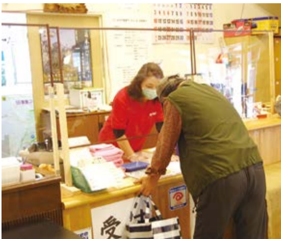
増富の湯の受け付けで館内利用の説明を聞く利用者