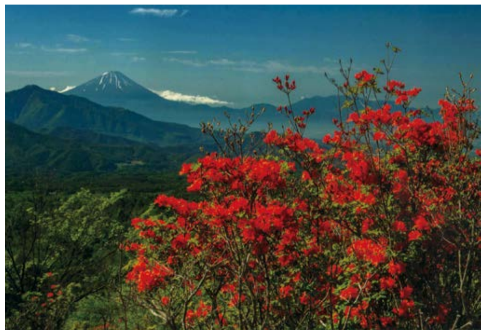
「富士山遠望~美し森より」 Canon 5D mark IV 24-70mm S:1/60 F:16

Photo Studio Shimizu 清水写真店 長坂駅前通り店:本店 TEL 32-2105 長坂IC前:きららシティ店 TEL 32-8121