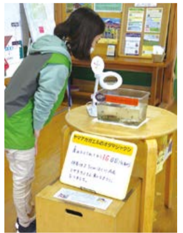
ヤマアカガエルのおたまじゃくしを飼育しているコーナー

特別展を延長 長坂町の北杜市オオムラサキセンターが5月26日に営業を再開した。5月上旬までを予定していた特別展「昆虫食ワールド」の会期を延長して開催している。 かつて日本では50種類以上の昆虫が食用とされ、全国各地でイナゴやハチノコなどが食べられていたが、現在、昆虫食文化は急激に衰退しているという。 同展では、伝統的な昆虫の捕獲方法や調理方法のほか、NPO法人昆虫